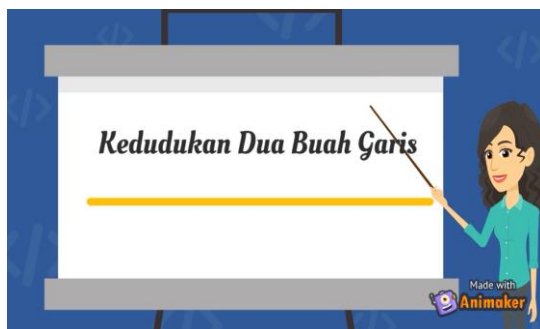
Gambar 3. Subbab Kedudukan dua buah garis