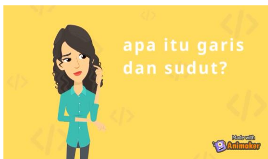
Gambar 2. Tampilan pembuka materi garis

muncul ketika pengguna membuka media video pembelajaran animasi berbasis animaker materi garis dan sudut. Untuk selanjutnya pembahasan materi tentang garis dan sudut. Gambar materi berisi tentang subbab materi dari garis dan sudut. Pada bagian ini memuat 4 subbab dari materi garis dan sudut yaitu kedudukan dua buah garis, bagian-bagian sudut, jenis-jenis sudut dan hubungan antar sudut. Pada tiap-tiap subbab terdapat materi dibuat oleh peneliti semenarik mungkin, sehingga dapat menarik minat belajar siswa terhadap pembelajaran.