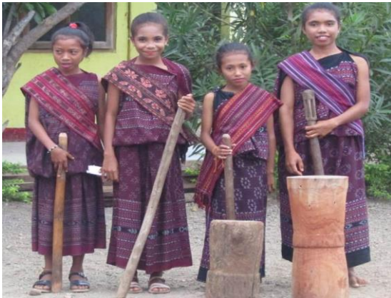
Gambar 1: Alu dan Lesung sebagai Alat Musik Pengiring Tarian Raja Sine

Berdasarkan hasil wawancara yang diperoleh peneliti, dari beberapa narasumber mengenai alat musik bahwa alat musik yang digunakan tidak menggunakan alat musik khusus tetapi tarian ini diiringi dengan suara tumbukan Alu dan lesung.