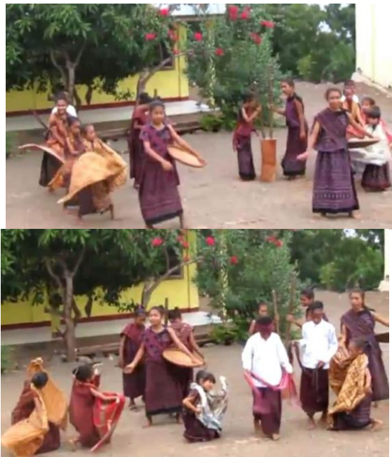
Gambar 2: Anak-anak SDK Lewowuran Flores Timur NTT sedang menarikan Tarian Raja Sine

yaitu kwate ua sugi sarung khas masyarakat Lewouran yang digunakan oleh gadis-gadis dan selendang serta snae yang digunakan oleh pemuda-pemuda (wawancara dilakukan pada tanggal 29 April 2019).