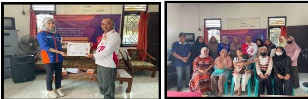
Gambar 4. Pelatihan Perizinan Produk

Pelatihan ini bertujuan untuk memberikan informasi serta mendampingi para pelaku UMKM untuk pendaftaran dan pengurusan Sertifikasi Halal dan Nomor Induk Berusaha (NIB).