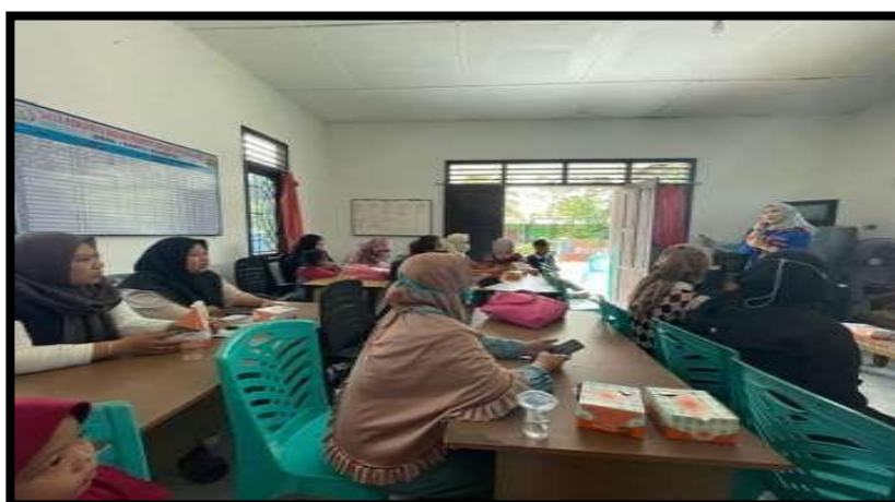
Gambar 2. Pelatihan Digital Marketing

Pelatihan ini bertujuan untuk meningkatkan optimalisasi penggunaan media sosial dan marketplace bagi para pelaku UMKM. Materi yang diberikan yaitu Dasar-Dasar Digital Marketing , Social Media Marketing dan Mengelola Toko Online .