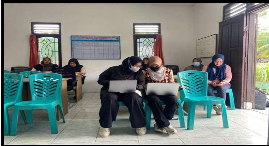
Gambar 3. Pelatihan Laporan Keuangan

Pelatihan ini bertujuan untuk membekali para pelaku UMKM mengenai pembuatan dan penyusunan laporan keuangan. Materi yang diberikan yaitu Dasar Pengelolaan Keuangan, Aplikasi Pengelolaan Keuangan dan Akses Permodalan.