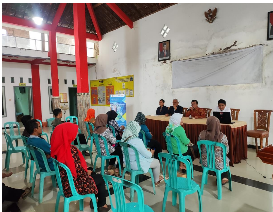
Gambar 1. Pelaksanaan pengabdian kepada masyarakat di Desa Kendalrejo

berdaya berdasarkan tiga hal: 1) Menciptakan daya tarik, 2) Penguatan usaha, dan 3) Peningkatan kapasitas Sumber Daya Manusia (SDM).