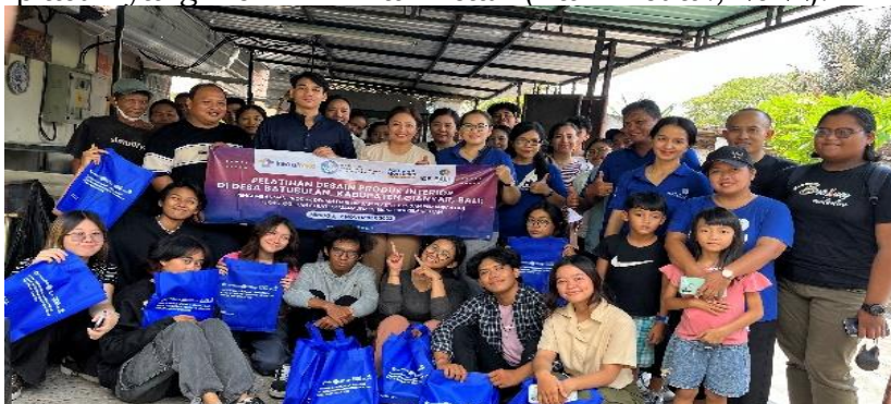
Gambar 4. Kegiatan pelatihan desain produk interior

Pelatihan sejenis terlihat pada PKM di Pulau Salemo yang menghasilkan kegiatan berupa peningkatan pengetahuan dan keterampilan pada kelompok pemuda Nelayan Rezki yang kurang produktif sehingga menghasilkan produk dari limbah plastik yang memiliki nilai kreatif (Hakim et al., 2022).