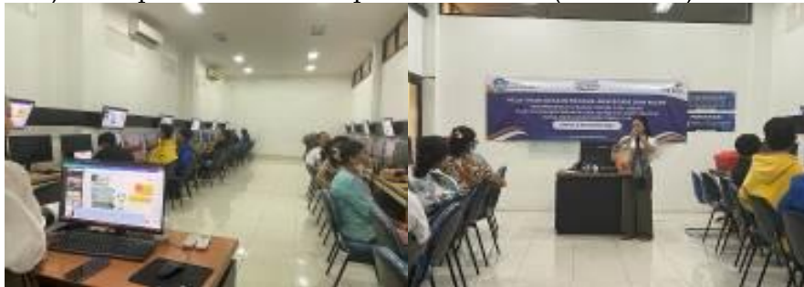
Gambar 3. Kegiatan pelatihan desain produk aksesoris dan mode

Dari segi unsur-unsur estetika berupa bentuk, pemilihan warna, proporsi, serta komposisi perlu dikembangkan lagi sehingga perlu berbagai pelatihan yang berkaitan dengan desain produk. Keterbatasan desain produk karena pengelola UMKM ini belum memiliki ilmu mengenai pembuatan suatu desain produk yang berkualitas. Maka dari itu diadakan pelatihan berkaitan tentang desain produk yaitu pelatihan desain produk aksesoris dan mode (Gambar 3) serta pelatihan desain produk Interior (Gambar 4).