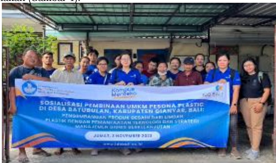
Gambar 1. Kegiatan sosialisasi pembinaan UMKM Pesona Plastic

Berdasarkan time table maka kegiatan pembinaan UMKM ini dimulai dengan melaksanakan sosialisasi kegiatan kepada pihak mitra. Sosialisasi kegiatan dengan memberikan time table /jadwal kegiatan yang telah dibuat dan memberikan penjelasan tentang program-program yang akan dilaksanakan (Gambar 1).