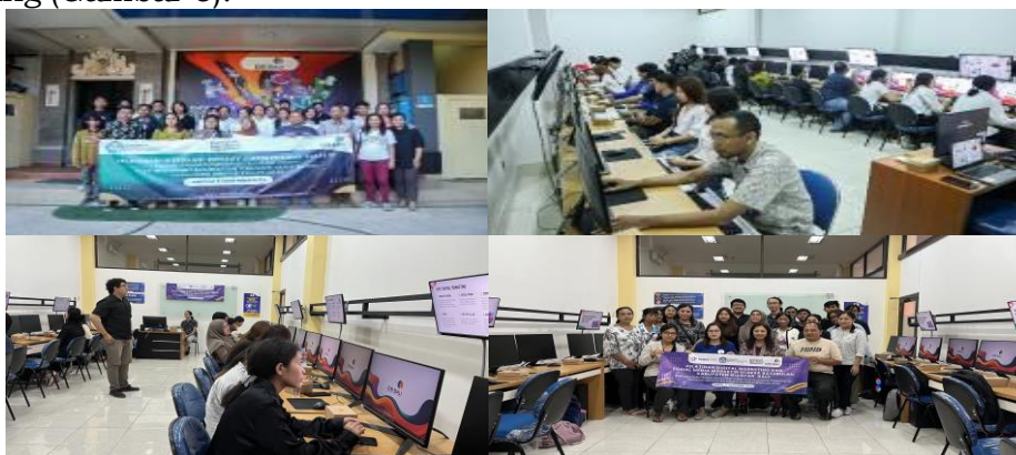
Gambar 5. Kegiatan pelatihan integrasi website, digital marketing dan Sosial Media Marketing

Permasalahan selanjutnya yaitu dalam bidang pemasaran masih sangat terbatas, pendistribusian hasil produk baru hanya ditiptikan di toko-toko saja, belum memiliki website dan akun platform ecommerce sebagai media pemasaran. Maka untuk menunjang proses pemasaran serta pengelolaan keuangan maka diadakan pelatihan integrasi website, pelatihan digital marketing, pelatihan manajemen kewirausahaan dan pengelolaan keuangan untuk UMKM dan PKK dan muda mudi dan pelatihan sosial media marketing (Gambar 5).