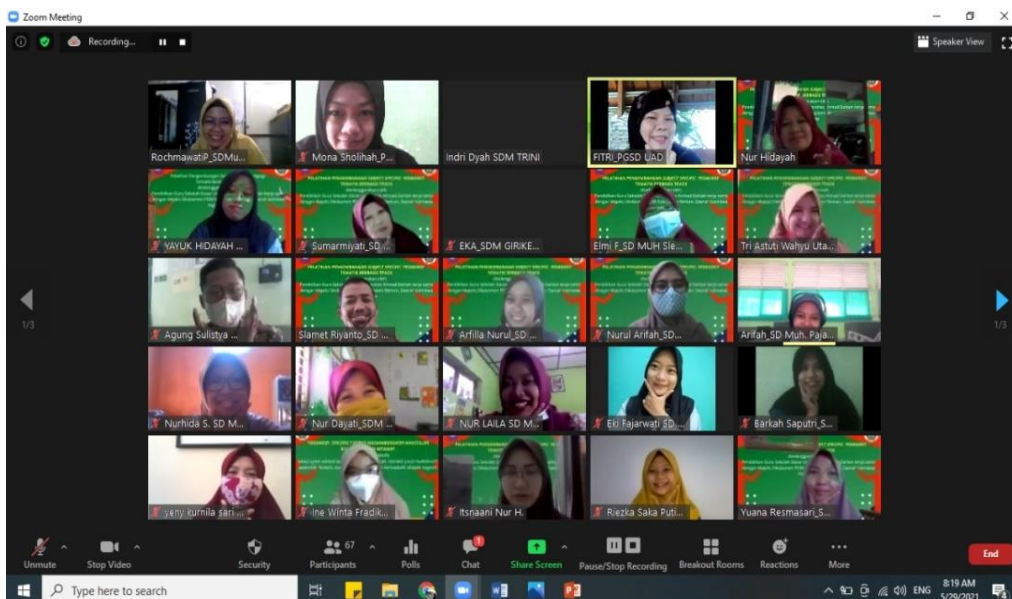
Gambar 2. Peserta pelatihan pengembangan subject spesifik pedagogi tematik berbasis TPACK

Kegiatan ini dilaksanakn secara online dengan menggunakan zoom meeting. Seperti namapak dalam gambar 2, Peserta pelatihan pengembangan subject spesifik pedagogi tematik berbasis TPACK. Kolaborasi antara teknologi dan materi dalam subject spesifik tematik berbasis TPACK turut serta mengintegrasikan keterampilan dan pengetahuan siswa. Rofiah & Kawai (2020) menyatakan jika karakteristik anak dalam belajar disesuaikan dengan berkebutuhan khusus untuk mengetahui model pelaksanaan pembelajaran. Dapat dicermati bahwa dalam subject spesifik pedagogi tematik berbasis TPACK telah menerapkan prinsip eketif, efesien dan mengacu pada kebutuhan siswa.