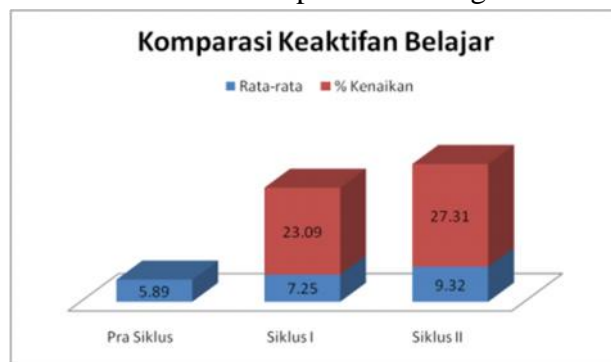
Gambar 1 Komparasi Keaktifan Belajar

Dari tabel tersebut dapat diketahui grafik sebagai berikut