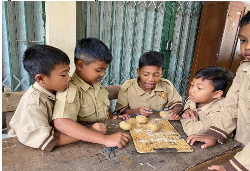
Gambar 2. Proses perancangan membuat energi listrik dari kentang

Selanjutnya peserta didik secara berkelompok melakukan eksperimen mengenai pembuatan energi listrik dari kentang ( Gambar 2 dan Gambar 3 ). Pada proses ini, aktivitas CT yaitu algoritma tampak ketika peserta didik melakukan eksperimen. Terlihat saat peserta didik menyiapkan alat dan bahan serta mengikuti langkah-langkah dengan runtut supaya dapat menghasilkan energi listrik melalui kentang.