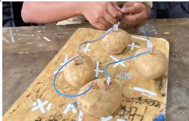
Gambar 3. Hasil karya energi listrik dari kentang

Selain itu, aktivitas CT fase pengenalan pola juga muncul ketika peserta didik mencoba 3 sampai 4 kentang yang digunakan. Sehingga peserta didik berpikir dengan semakin banyak kentang yang digunakan membuat arus listrik semakin bertambah yang menyebabkan nyala lampu menjadi lebih terang. Setelah berhasil melakukan eksperimen, peserta didik dapat berdiskusi mengenai kesimpulan dari eksperimen. Proses berpikir CT pada fase abstraksi muncul karena peserta didik dapat mengidentifikasi masalah penting bahwa kentang dapat menghasilkan energi listrik.